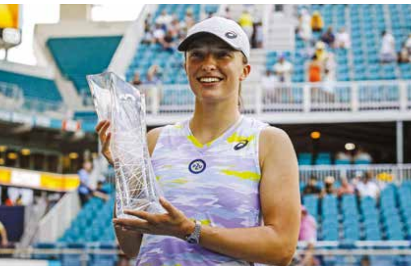
ZBIGNIEW MEISSNER / PAP