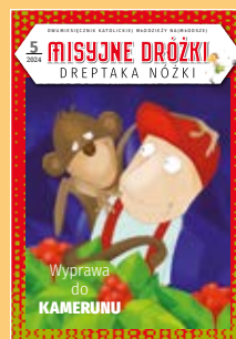
Misyjne Dróżki dodatek dla dzieci