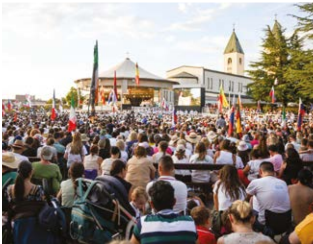
MARIA LEŻAŃSKA MEDJUGORJE YOUTH FESTIVAL/FACEBOOK