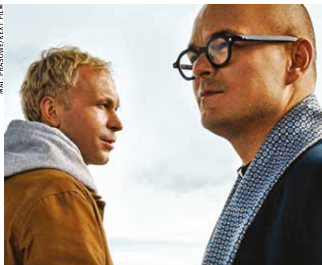
MAT. PRASOWE/NEXT FILM