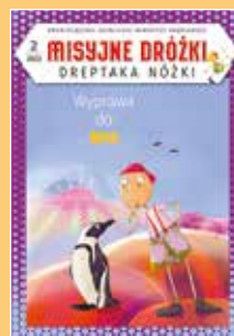
Misyjne Dróżki dodatek dla dzieci