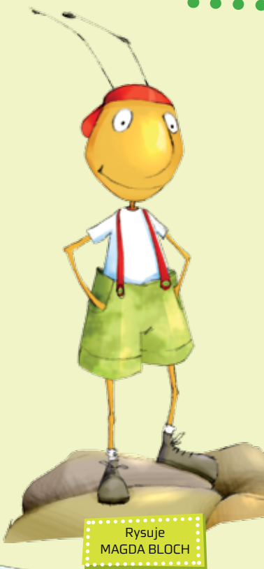
Rysuje MAGDA BLOCH