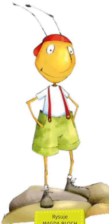
Rysuje MAGDA BLOCH

WITAJCIE, DRODZY CZYTELNICY! TO JA – DREPTAK NÓŻKA!