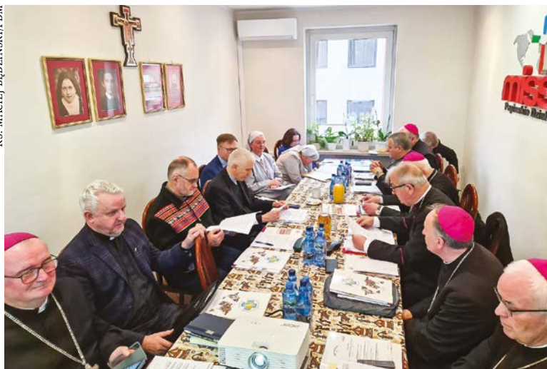
KS. MACIEJ BĘDZIŃSKI/PDM