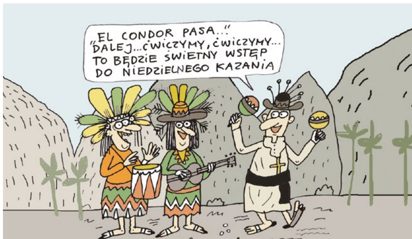
„EL CONDOR PASA” – PRZELOT KONDORA