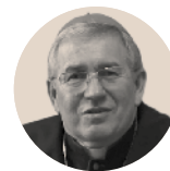
BP JERZY MAZUR SVD