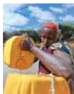
zdjęcie na okładce UNDP