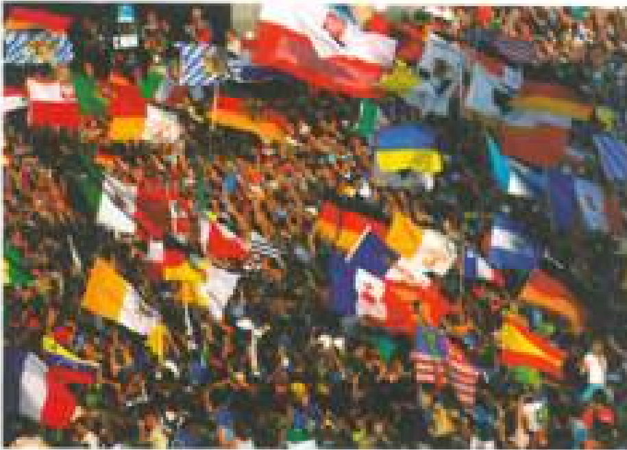
Na brzegu Renu Papież pozdrawiały tłumy młodzieży, refleksyjne gęły wysładał przy Hohenzollernbrücke

naszego świata? Komu mogę ufać - komu zawierzyć? Gdzie jest Ten, który może dać mi odpowiedź na oczekiwania serca? Stawianie podobnych pytań oznacza przede wszystkim, że uznajemy, iż nasza droga nie jest zakończona, dopóki nie spotkamy Tego, który ma moc odnowić to powrosem królestwo sprawiedliwości i pokoju, którego ludzie tak pragną, lecz nie są zdatni stworzyć go sami. Stawianie te-