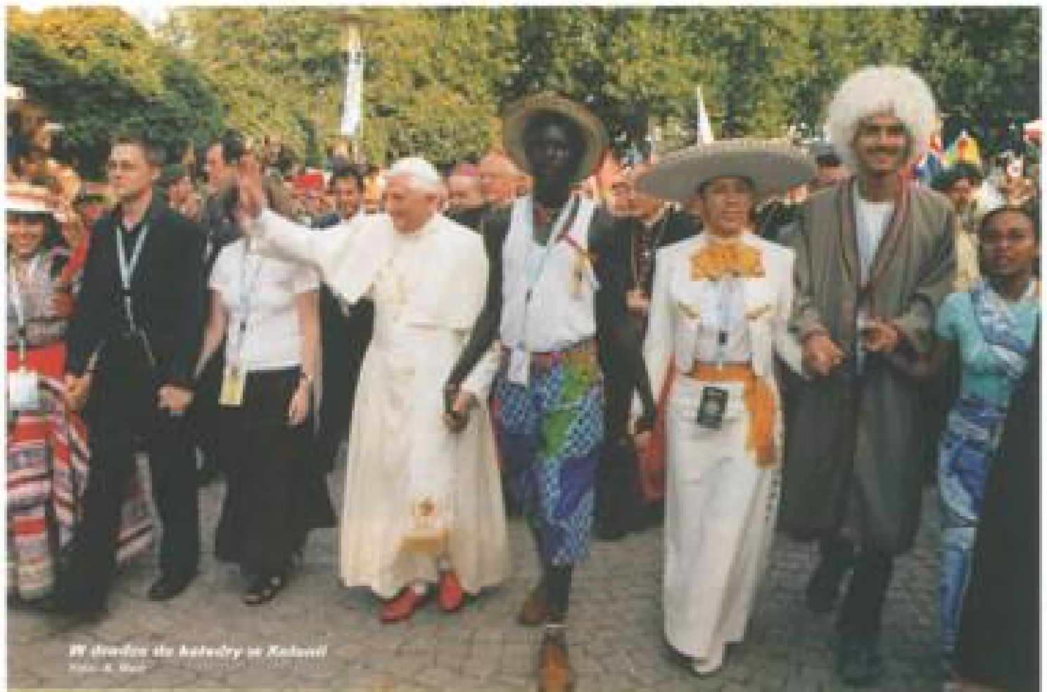
W drodze do katedry w Kolonii