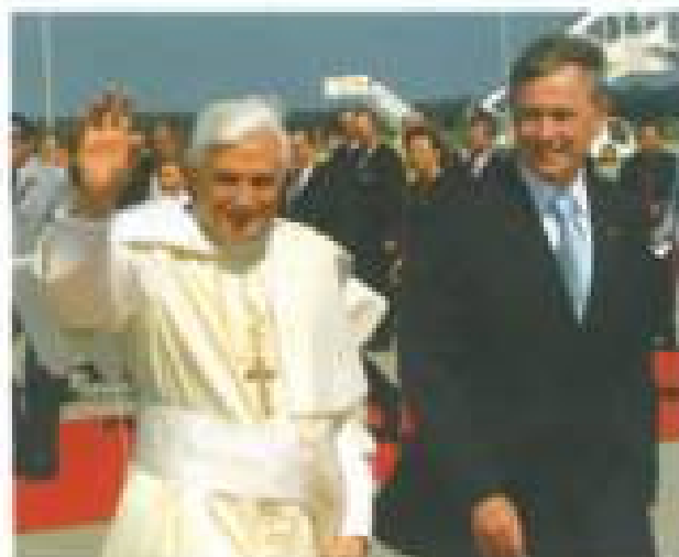
Benedykt XVI z prezydentem Niemiec H. Köhlerem po przywitaniu na lotnisku w Kolonii

Oddał Bogu pokłon, adorował Go, aby potem wyruszył z drogą nową na misyjne drogi. Tak w skrócie można oddać treść kolofialnego spotkania młodych świata z Papieżem. Benedykt XVI przyjechał do Kolonii 18 sierpnia. Już od tygodnia w diecezjach niemieckich młodzież przeżywała rekolekcje w oczekiwaniu na Dnia Świętego. Na lotnisku im. Konrada Adenauera pod Kolonią Benedykta XVI powitali prezydent Niemiec Horst Köhler, kanclerz Gerhard Schröder, metropolita kolofialski kard. Joachim Meisner oraz przewodniczący Konferencji Biskupów Niemiec, kard. Karl Lehmann. Ojciec Święty przywitał swoją ojczyznę z nieskrywanym wzruszeniem: „Z głęboką radością przybywam dzisiaj po raz pierwszy po moim wyborze na Stolicę Piotrową do mojej drogiej ojczyzny, Niemiec. Z żywym wzruszeniem dziękuję Bogu, że pozwolił