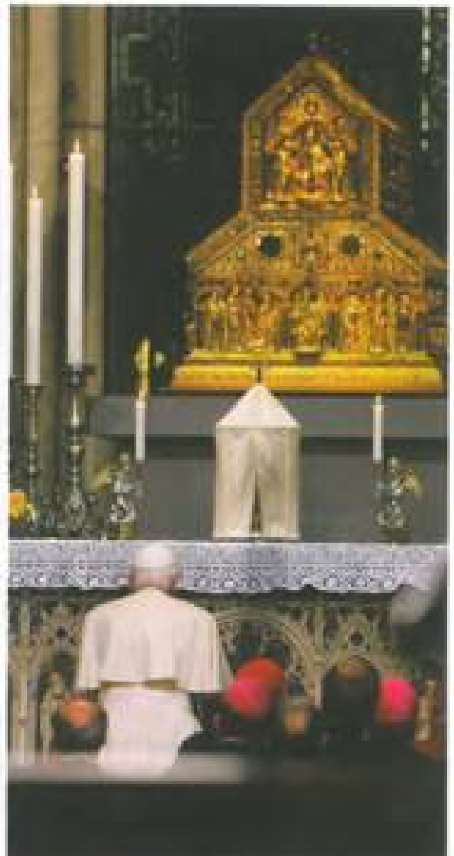
Modlitwa przed relikwiarzem Trosk Krola w katedrze kolonickiej

statku skierował do młodych, licznie zgromadzonych na brzegach rzeki, słowa ojcowskiej zachęty: „W czasie tych dni możecie odnowić to namacalne doświadczenie modlitwy rozumianej jako dialog z Bogiem, poprzez który czujemy się kochani i sami uczymy się kochać. Wam wszystkim chcę powiedzieć z całą mocą: otwórzcie wasze serce na Boga, pozwólcie zakoczyć się Chrystusowi! Przekazcie Mu «prawo do mówienia do was podczas tych dni. Otwórzcie drzwi waszej wolności na Jego miłosierną miłość. Złóćcie wasze radości i wasze ciężary Chrystusowi, pozwalając, by On oświecił wasz umysł swoim światłem i dotknął waszą taskę waszych serc”. Papież podjął też szereg egzystencjalnych pytań, jakie rodzą się w sercach współczesnych młodych ludzi, zaniepokojonych rozwojem sytuacji na świecie: „Gdzie znaleźć zasady dla mojego życia, gdzie zasady dla odpowiedzialnej współpracy w budowaniu teraźniejszości i przyszłości